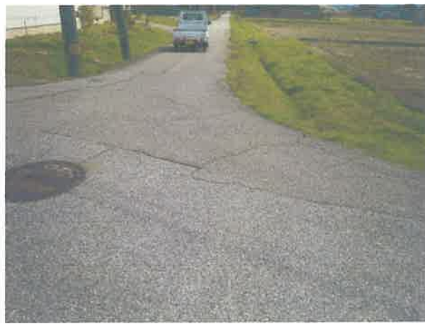
電柱があって大型車が右折しにくい