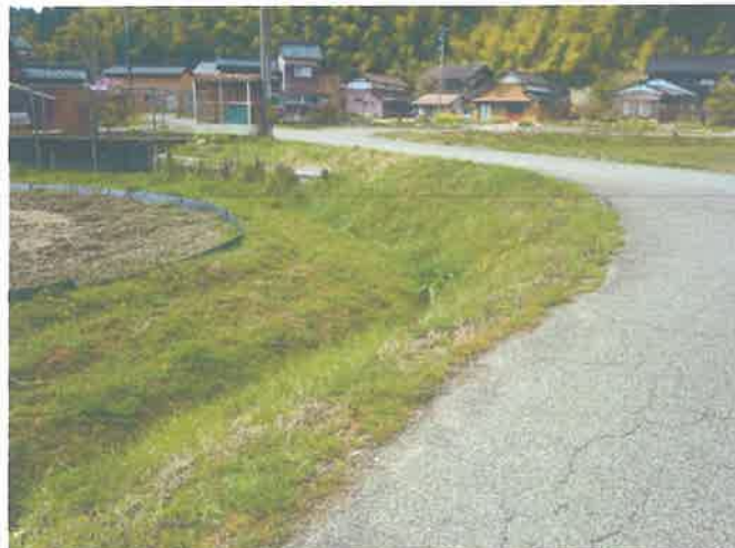
泥止めしてある部分までが、市道の一部分か否かは不明