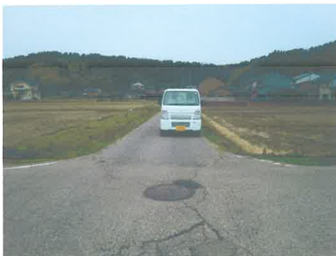
(軽自動車のすれ違いができない)