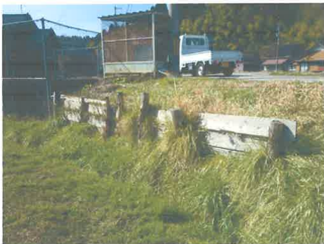
路肩の泥止めが老朽化して崩壊寸前