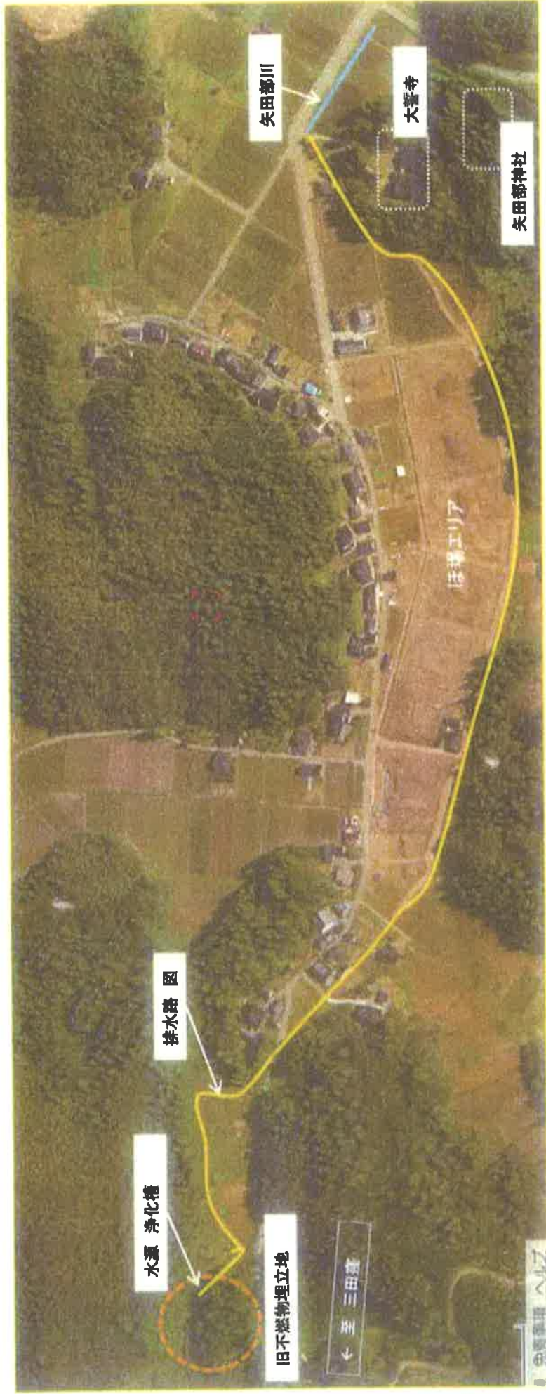
●旧不燃物埋立地からの排水路 見取図