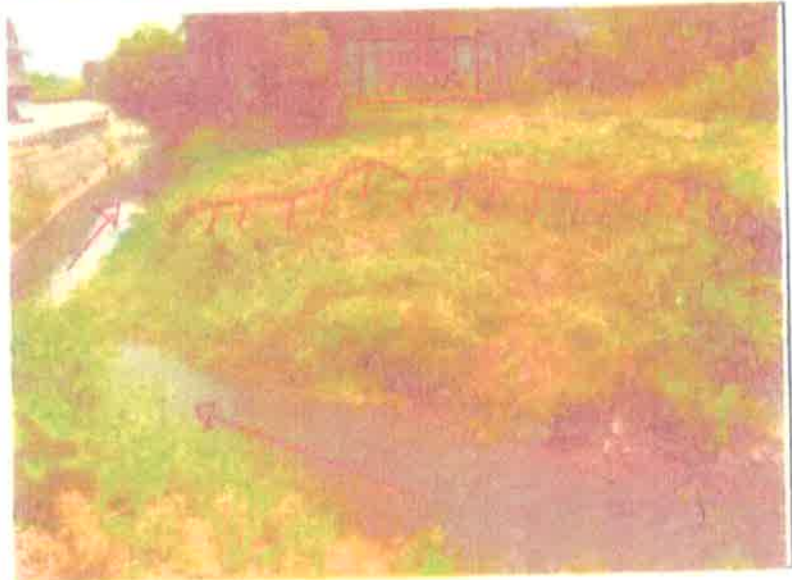
大覚口集落 河川工事 着工前