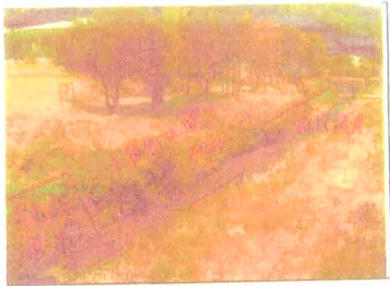
大覚口集落 河川工事 着工前