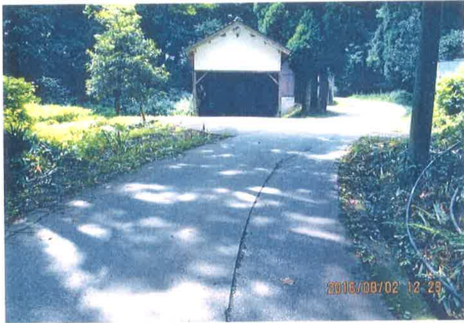
市道併池能越く景