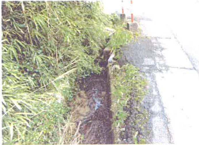
③市道横断暗渠の 改修・修繕