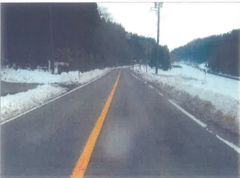
谷屋地内 熊無 谷屋村境 付近 谷屋方面向