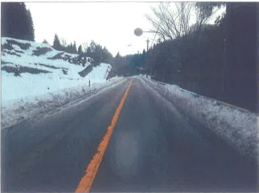
熊無地内 追分交差点~ 谷屋方面200M地点