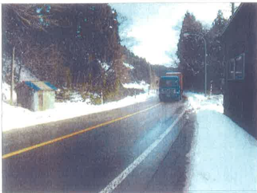
熊無地内 附近 谷屋方面向