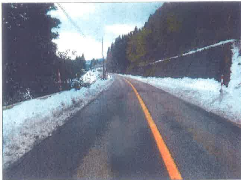
谷屋地内 フェーン脱着場付近 熊無向