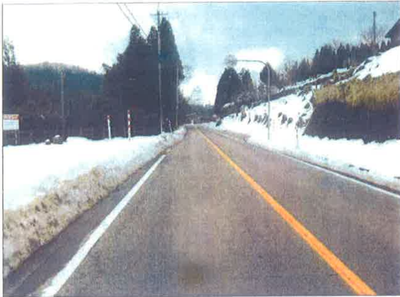
熊無地内 熊無 谷屋村境 熊無方面向