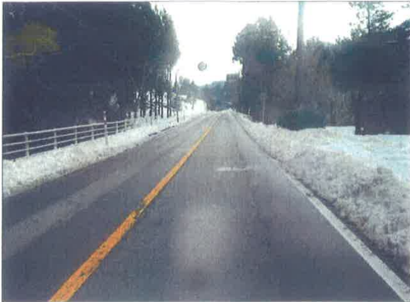
熊無地内 追分交差点~ 谷屋方面 宅付近