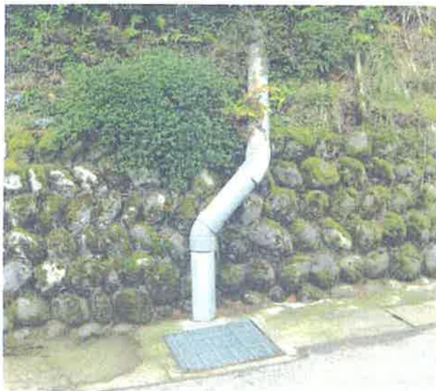
中間点より 上部を望む