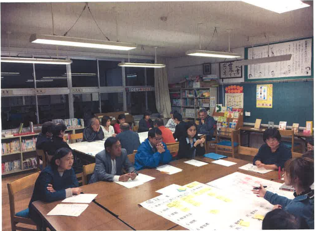
(参考) 検討会の様子