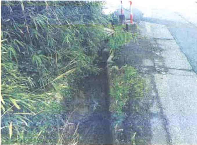
③市道横断暗渠の 改修・修繕