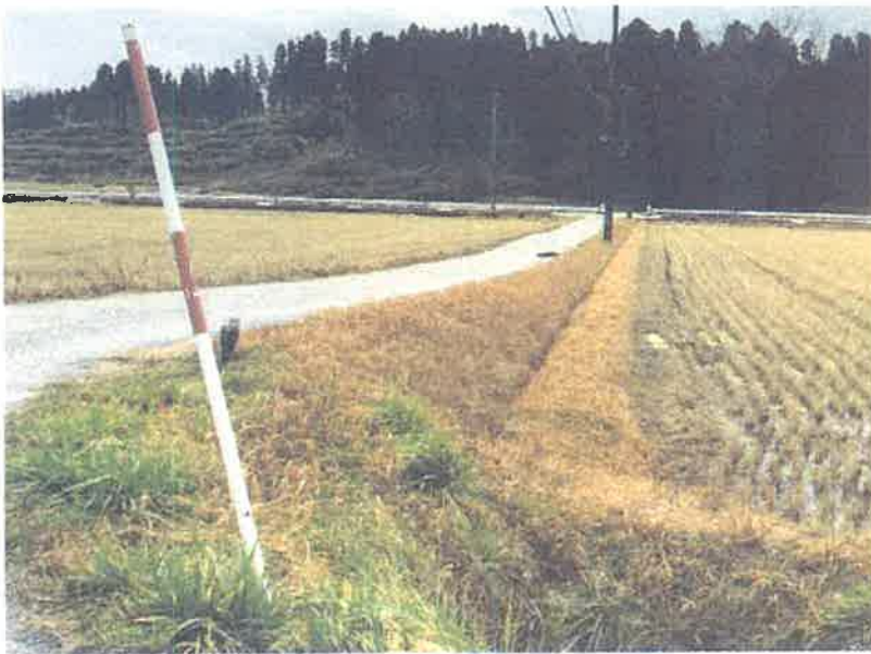
③ 鳥越道路 拡幅