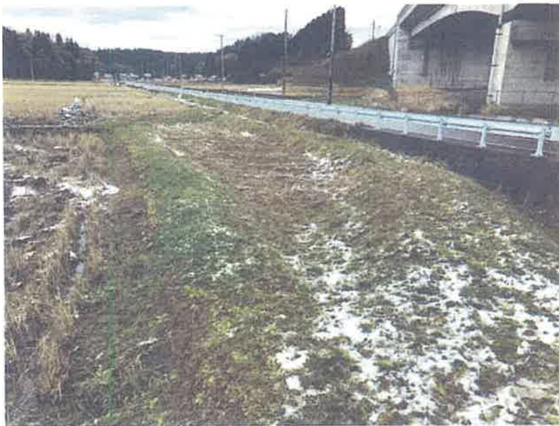
⑦ 田んぼに復旧箇所