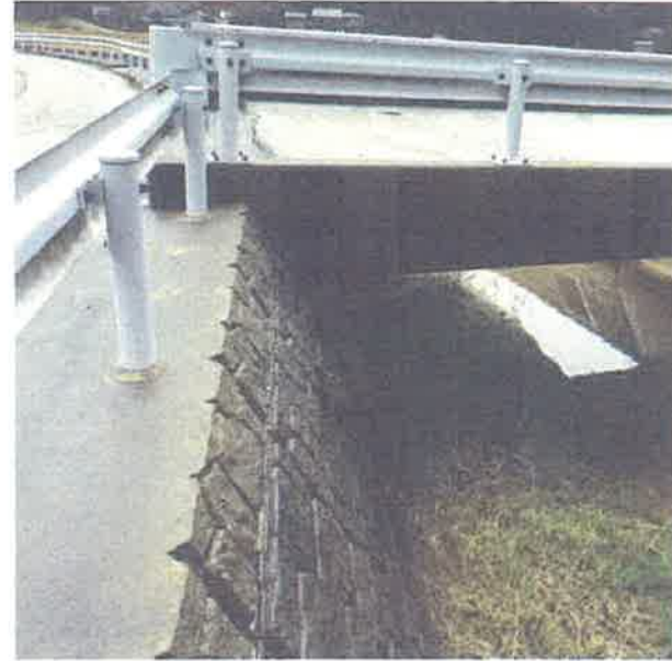
⑥ 能越道の下の箇所 ブロック亀裂、破損