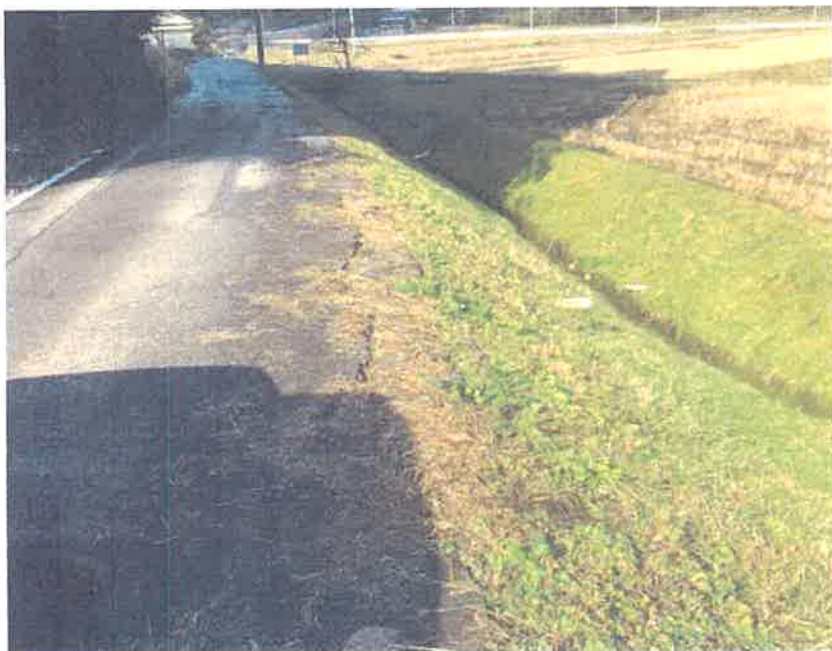
⑪ 源の谷内池 下の道路(舗装亀裂)