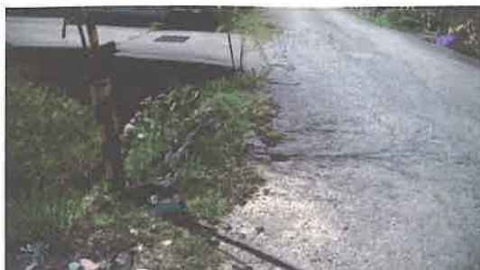
1 側溝・路肩改修（裏出地区）要望箇所