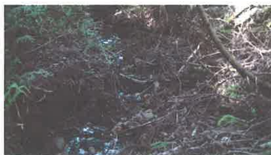
3 上庄川沿い道路退避スペース整備要望箇所