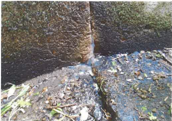
余水吐水路堤体側目地より漏水