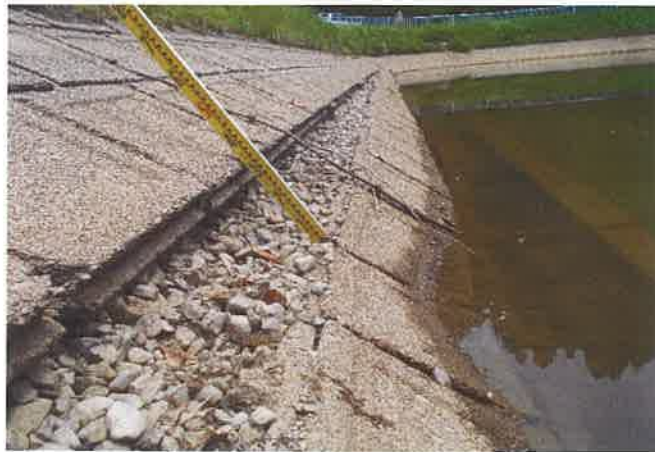
張ブロック沈下・ズレ状況 (①拡大)