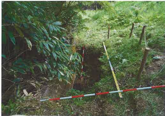
法尻付近陥没 (幅1.4m×深さ2.0m×延長5.0m)