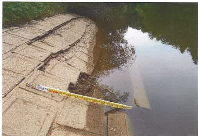
Co構造物及び張ブロックズレ状況 (②拡大)