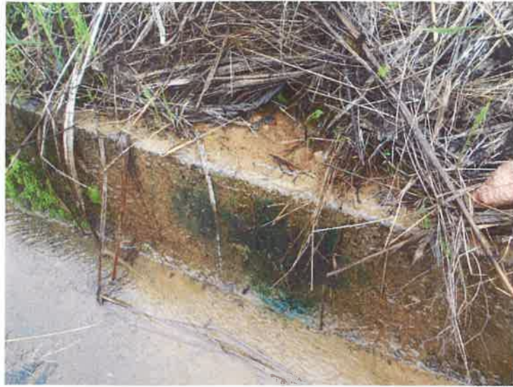
法尻の漏水状況（法尻全体にわたる）