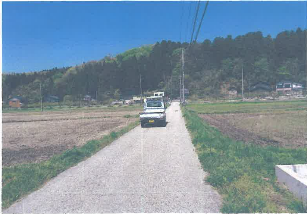
トライアライト道からの図