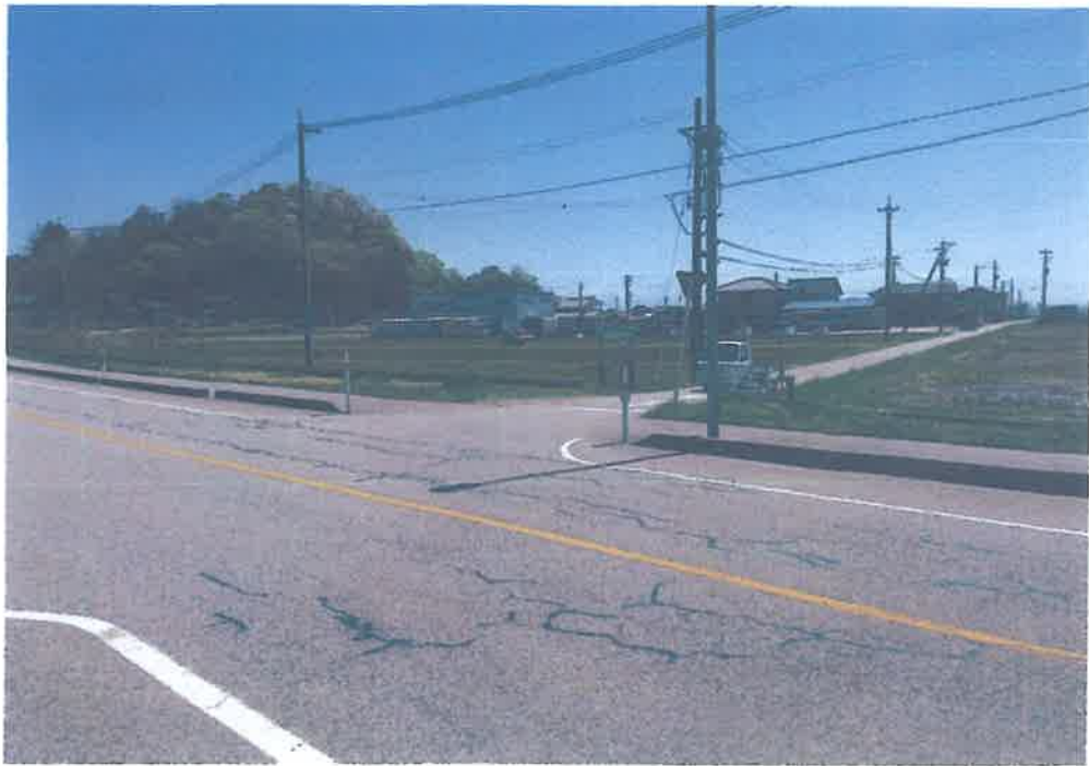
国道から右折の図