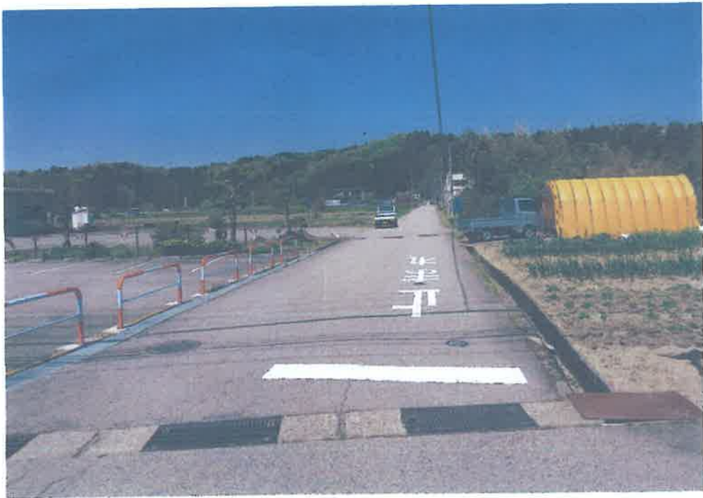
県道 救田 ~ 下田子約からの図