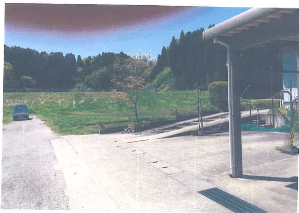
1番近い人家からの図