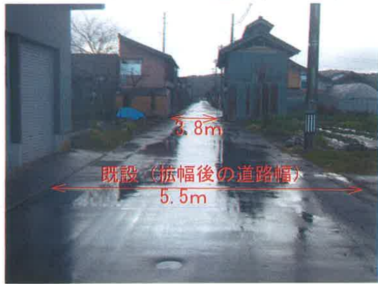
七分一側より 小学校方向望む