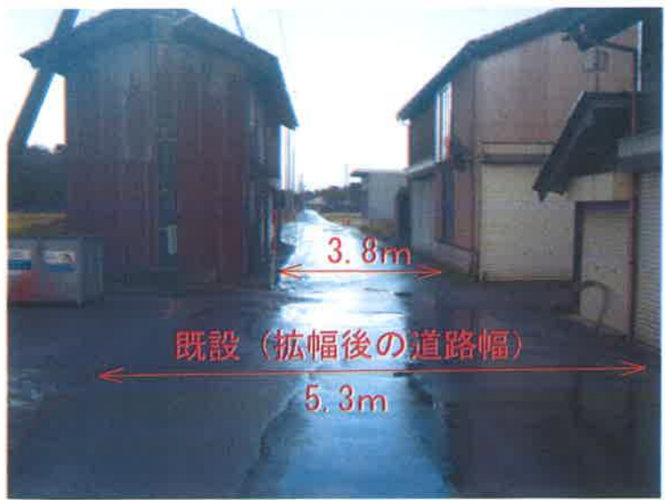
小学校側より 七分一方向望む