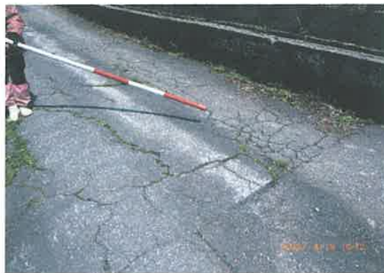
陥没ひび割れ箇所