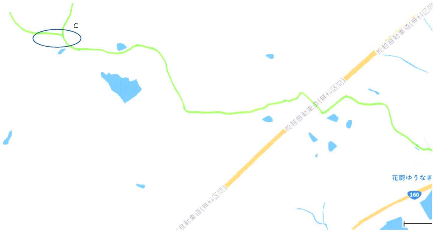
C 楯円内の場所 イノシシ被害