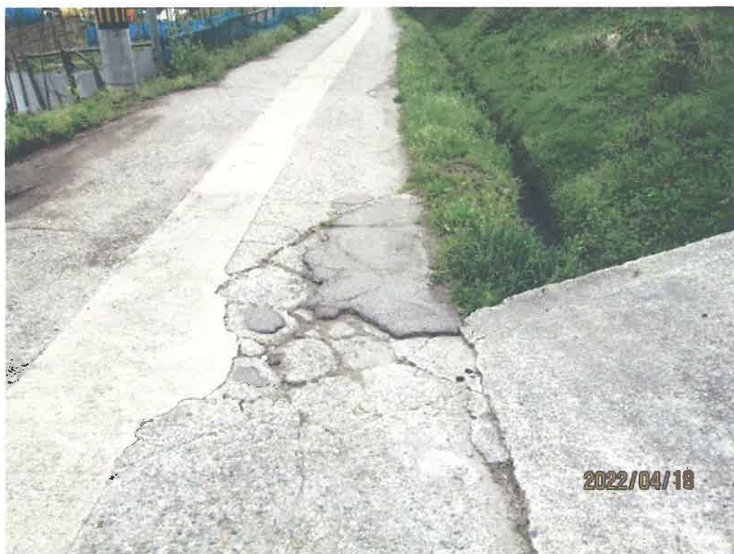
令和2年除雪車により破損した箇所