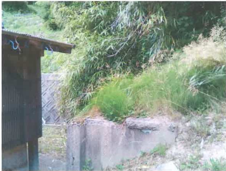
〇邸 母屋と別棟の裏側境目