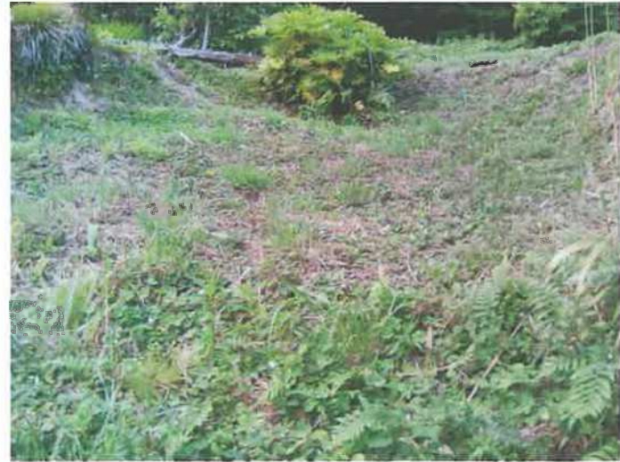
〇邸 母屋裏側 土砂流失の痕跡