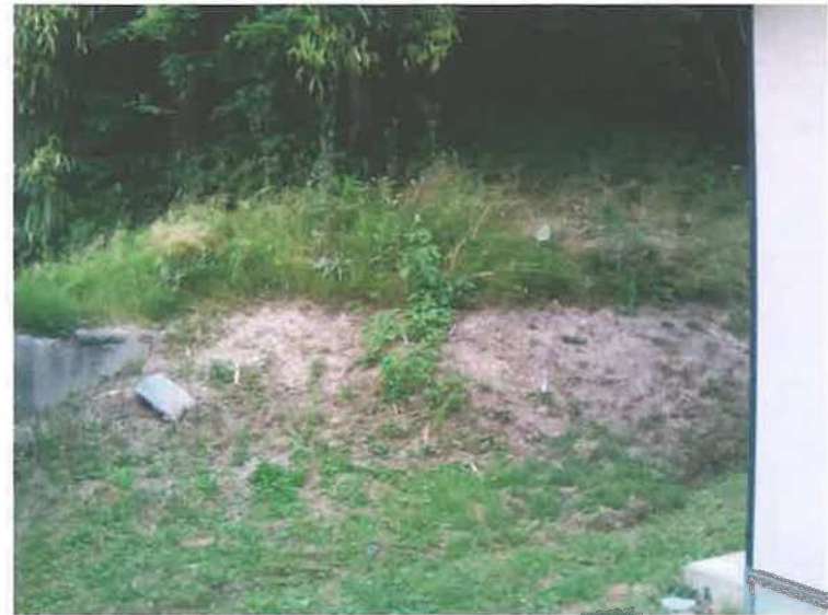
〇邸 母屋と別棟の裏側境目