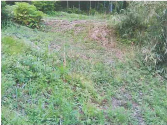
〇邸 母屋裏側 土砂流失の痕跡