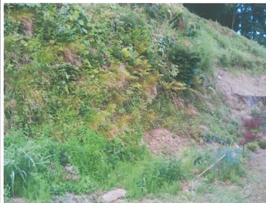
邸 土蔵と母屋の裏の境目