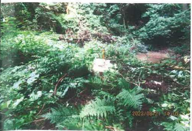
写真番号 014 撮影日 部位内容