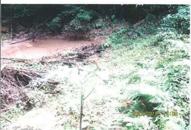
写真番号 撮影日 部位内容