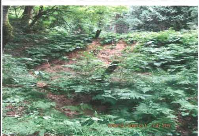
写真番号 014 撮影日 部位内容 既存用水用溜息跡土下手側崩壊