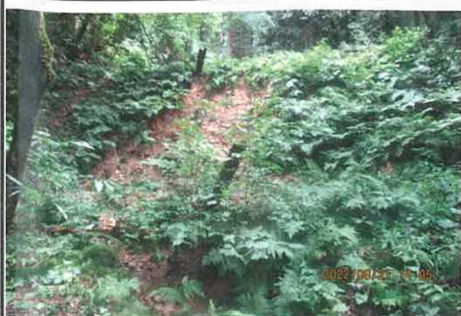
写真番号 013 撮影日 部位内容 氷見市白川2108 宅奥溜息