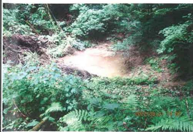
写真番号 撮影日 部位内容