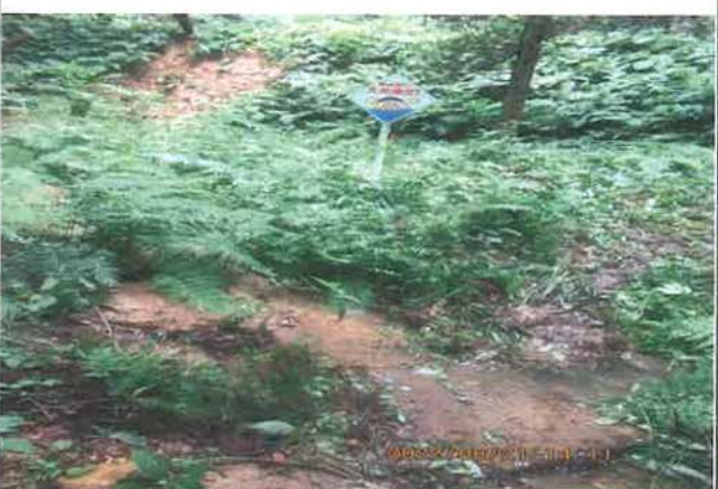
写真番号 015 撮影日 部位内容