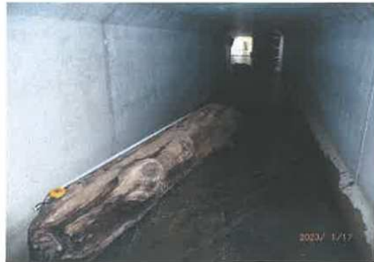
寄りまわり波 流木 2本