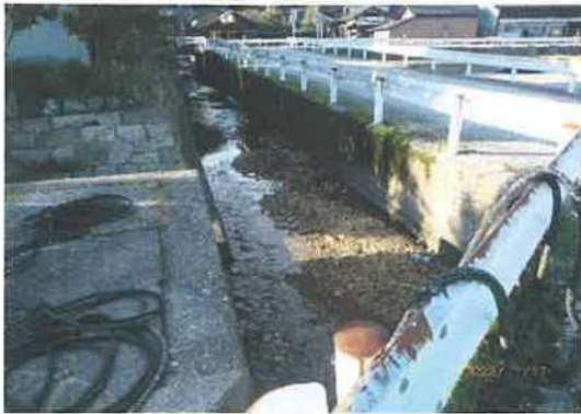
上原川土砂堆積物