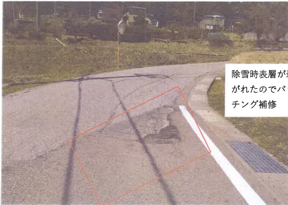
⑤市道論田菅池線の拡幅改良（車庫より、宅まで）新