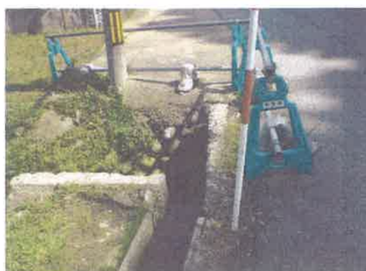
⑤ 付近 除雪車によると思われる損傷