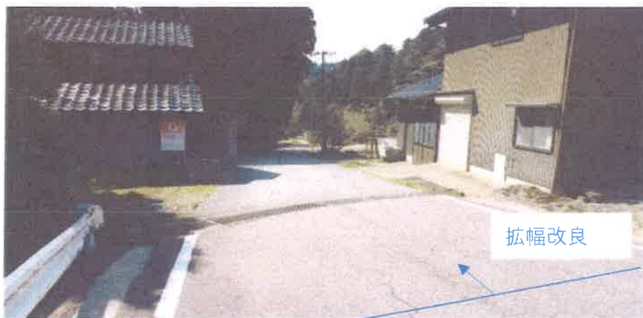
②市道内山線の道路中央～路肩沈下補修（ 車庫裏～ 宅中央付近まで）