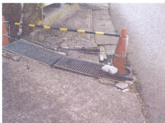
⑨ 神社前側溝 昨年度手摺又はガードレールを 申請スミ