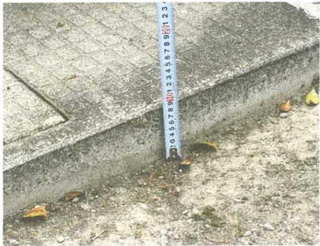
※数m離れると段差無し