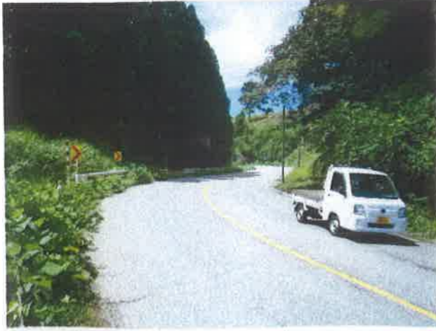
スノーシェッド 上り入口