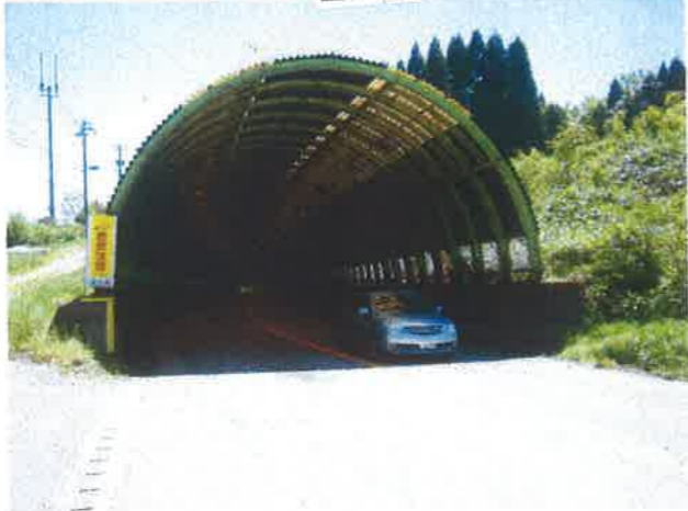
スノーシェッド 下り入口