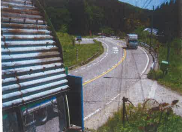
危険な急勾配・急カーブ